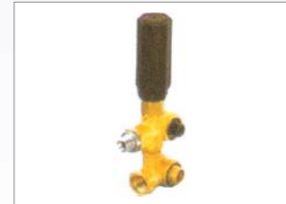
VR3B 300Bar, 35L/Min