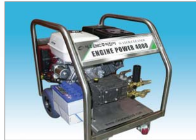
JE-150 / JE-250 / JE-380