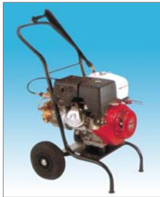
B16-220 / B16-250 / B20-220