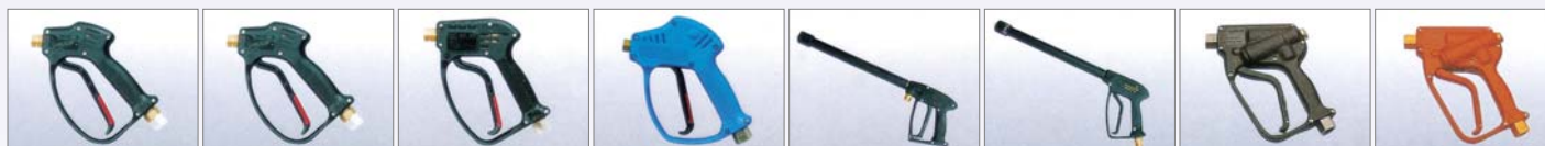
RL26 S/W 280Bar/30Lpm