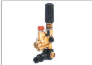
Combiset 140Bar, 11L/Min