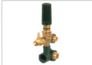
MINIMATIC 4/B 180Bar, 18L/Min