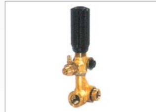
GYMATIC 3/B+HD 250Bar, 35L/Min